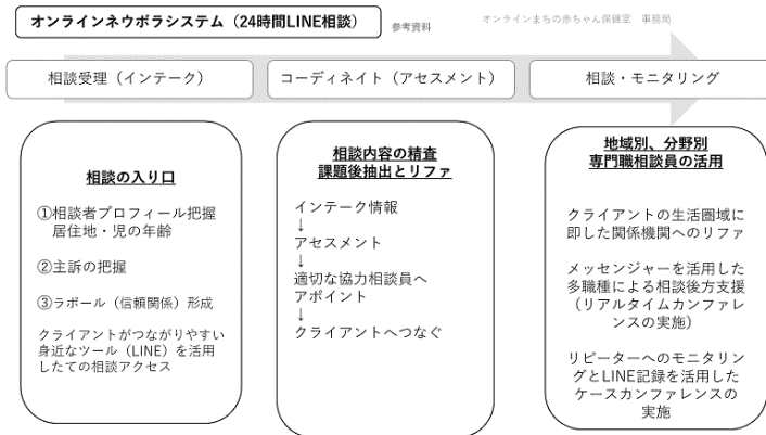
図 2 LINE 相談オンラインネウボラシステム (筆者作成)