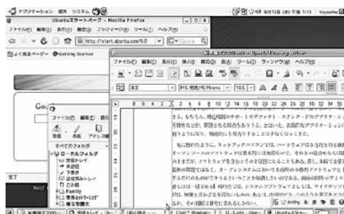
図2：オープンソフトウェアでのデスクトップ画面

先に触れたネットブックでは、ハードウェアは3万円を切る価格のものもある。オープンソースのソフトウェアは基本的には無償なので、それとの組合せならば価格はハードウェア価格のそのままである。一方、商用のソフトウェアを含む組合せと比較すると2倍近くの価格差になることもある。企業などで多数の導入となると、その影響は大である。但し、本稿で主張したいことは価格だけの問題ではなく、オープンシステムにおいても性能は当然のこと、商用の本格的ソフトウェアと十分に伍するだけのものができるという