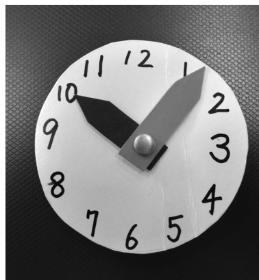
Fig. 2 手のひらサイズの時計

の言うとおりに、特別な支援が必要な子どもの発達を促すためには、幼稚園あるいは保育所と療育施設での経験のどちらも必要なのであろう。だからこそ、両者が連携し、それぞれの特徴を生かしながら保育に当たることが望ましい。