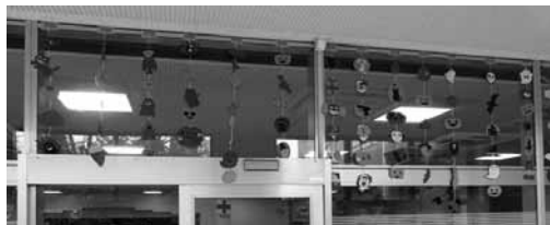
図 26 10月。カボチャ。魔女。猫。お化け。運動会など。