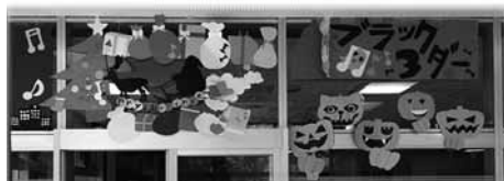
図 4 左はクリスマス、右はハロウィン。