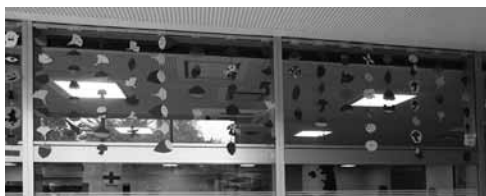
図 27 11月。焼き芋。銀杏。きのこ。栗など。