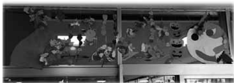
図 3 右側の大きな顔が印象的な壁面。

ステンドグラス風の装飾をやめることに決めたのは平成 25 年度の学園祭が終わった直後である。それ以降、次に何をするか考えてはいたのだが中々いいアイデアが浮かばなかった。そこで元々の目的の一つである、就職後の園内装飾に生かせるようなものをつくることに決めた。壁面装飾ならぬガラス面装飾である（図 3~14）。ただし、本学ではガラス面へのテープ接着は禁止されている。細かい装飾は糸で吊るしてガラスの枠の部分に貼る、という形になる。その年の学園祭テーマが「音色～一人ひとりが奏でるメロディ～」だったので、全クラステーマは音楽とした。そしてその音楽というテーマに、クラスごとの味付けをしてもらって制作を開始した。