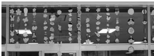
図 19 3月。お内裏さま。おひな様。梅。桜。蝶など。