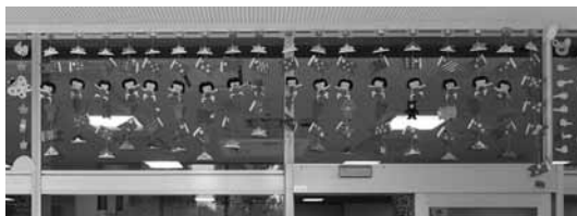
図 21 5月。金太郎。兜。鯉のぼり。クマなど。