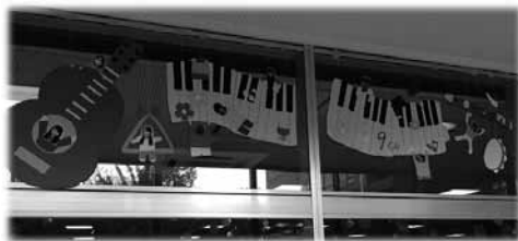
図11 クラスの学生の顔写真を使用して効果を上げている。