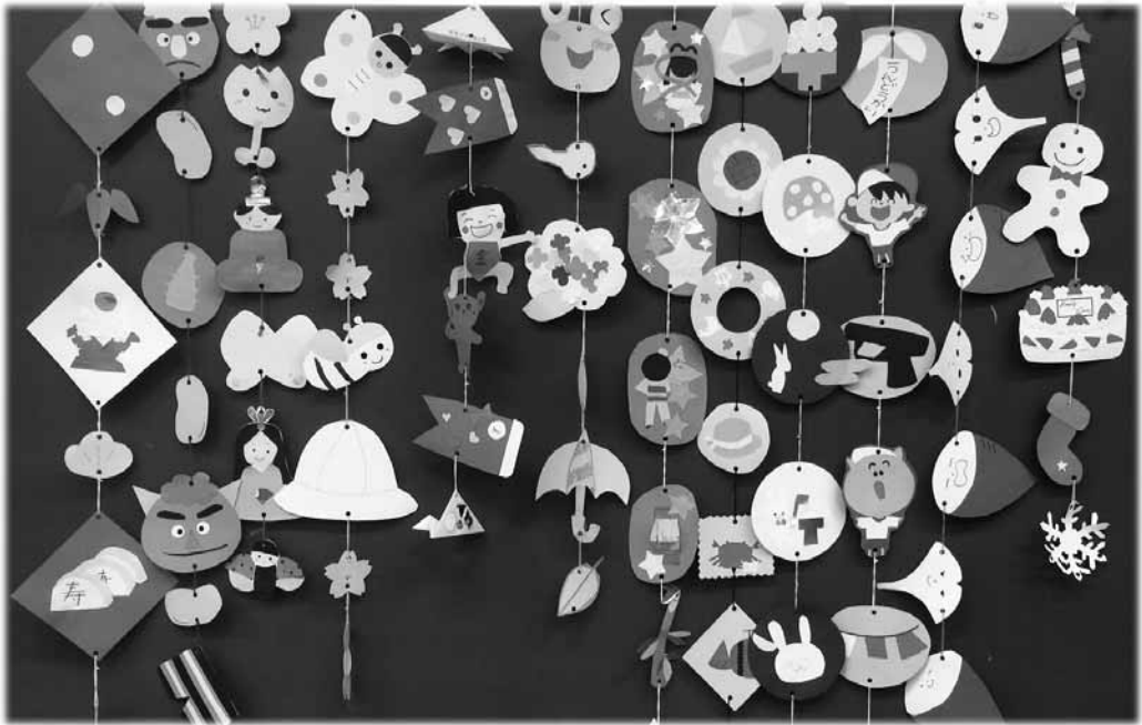
図30 学園祭の展示後、1～12月までの装飾を1本ずつ集めたもの（図工室に展示してある）2/2