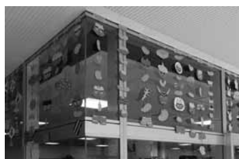
図18 2月。鬼の顔。鬼のパンツ。 金棒。豆など。