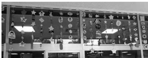
図 23 7月。織り姫さま。彦星さま。天の川。竹。星など。