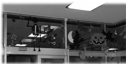
図8 ハロウィン。糸でつなげた骸骨が面白かった。