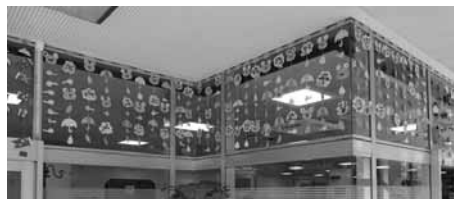
図 22 6月。かえる。水のしずく。あじさい。傘など。