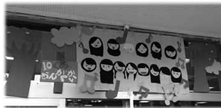
図12 クラスメイトの似顔絵を切り絵で制作している。