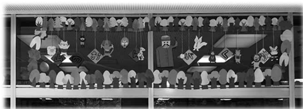
図5 森の音楽隊。クラスのまとまりがあり、一番時間をかけていた。