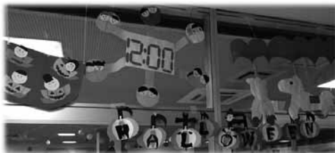
図14 ハロウィンと遊園地。