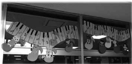
図13 鍵盤と動物と音符。