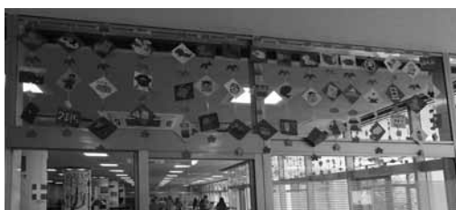
図17 1月。干支の動物。サイコロ。お餅など お正月に食べる物など。