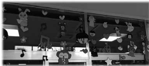
図9 音符とハートと動物と子ども達。