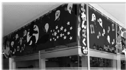
図7 おばけと魔女。他のクラスより広い面積。