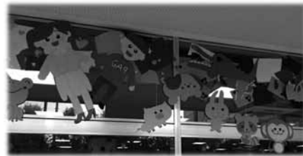
図10 人物や動物を大きく配置した。