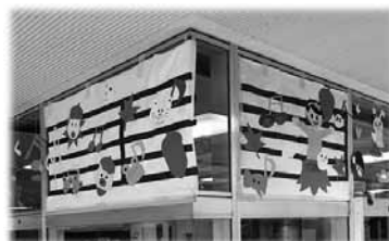
図6 楽譜を模造紙で制作。