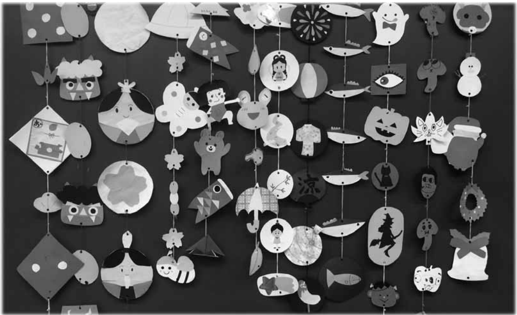
図 29 学園祭の展示後、1～12月までの装飾を1本ずつ集めたもの（図工室に展示してある）1/2

将来保育者になって協力して仕事を進めていくことを考えると、②や③のタイプが望ましい。短い時間で多くのパーツを作ることができ、仕上がった本数も多く、展示した時に美しく見える。最も完成物が少なかったのは、①のクラスで、しかも質にばらつきがあった。しかし①の中には非常に高い能力を発揮する学生が多数いたクラスもあった。同じようなものをつくるのではなく、個々の力量を遠慮することなく発揮できたからであろう。今回の成果を全体的に見れば②の進め方が、集団の力と個人の力が最もバランスよく出せる共同制作になると思われる。次年度の校内装飾では、集団の力と個人の力をさらに発揮できるように、さらには保育者になった時の視点も獲得できるような授業をつくっていきたい。