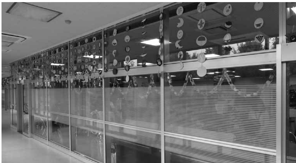
図15 装飾の展示風景。廊下側から見たもの。