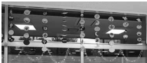
図 25 9月。お月見。うさぎ。団子。秋刀魚など。