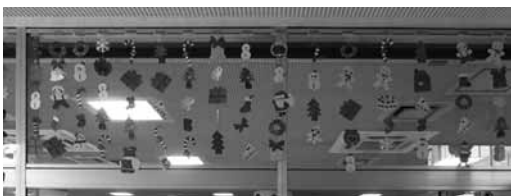
図 27 12月。サンタクロース。ケーキ。鈴。雪の結晶など。