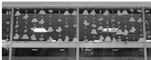
図 20 4月。幼稚園の帽子。桜。蝶。お団子。蜂など。